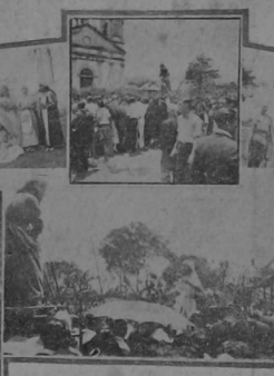
En la obaja de la mañana; en la tarde momentos en que la Velación enajaba el rostro del Nazareno. En el centro, aspecto que se lava las manos. Requiere de arribas las señorías que simulan a la Virgen María, a la izquierda: María, a la derecha: María. En el centro: el Nazareno.